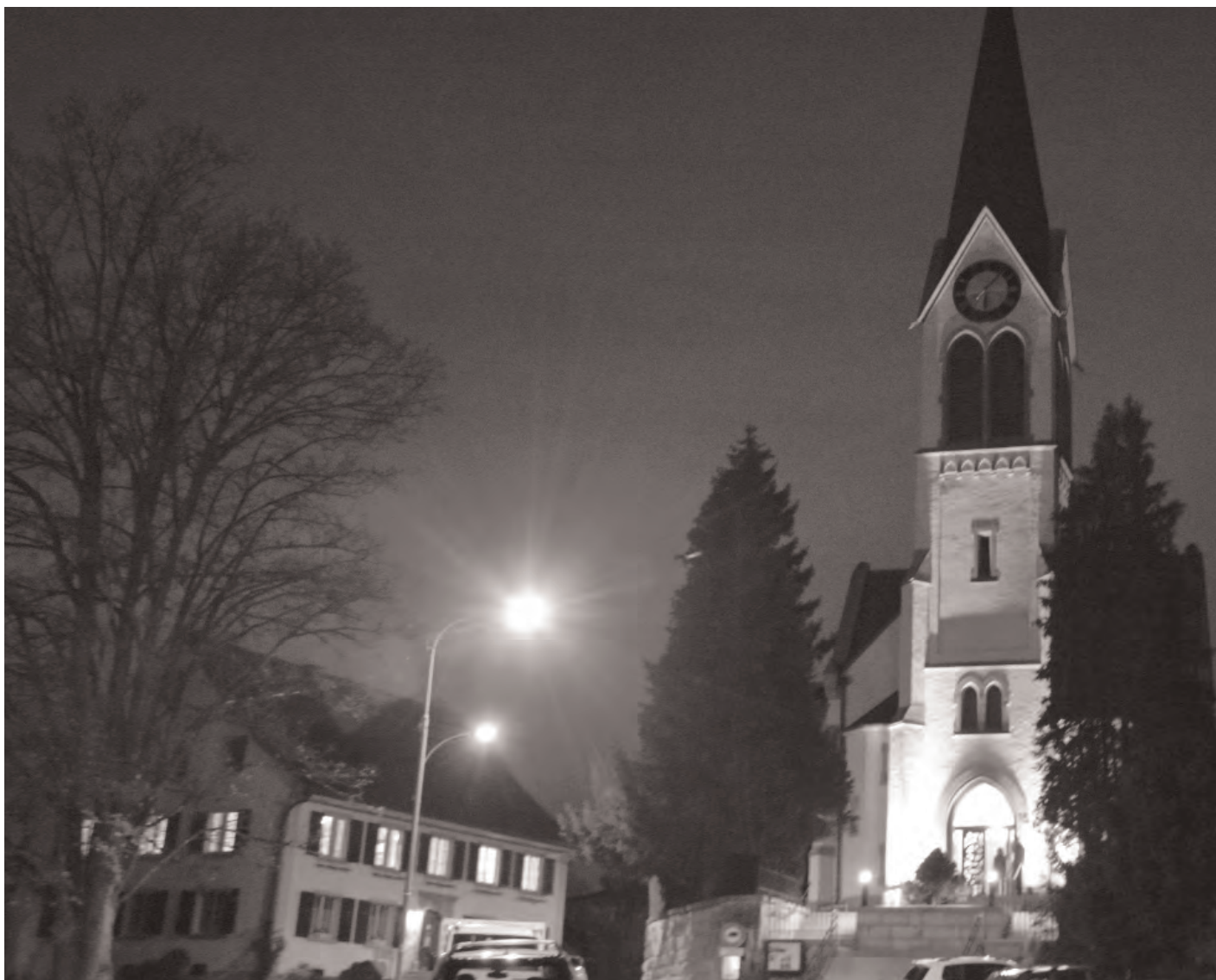
Die Kirche Lindau in weihnächtliches Licht getaucht.