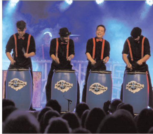
Eine Truppe, die das Zelt zum Kochen brachte: «Drums2Streets» mit ihrer Show «Roads of America».

Reise «rund um d'Wält» mitnehmen. Doch offensichtlich fühlt sich das kleine Publikum zu Hause am wohlsten, denn es liess sich fast niemand für diese Reise begeistern. Im Juni folgte dann ein Riesenevent mit «Drums2Streets». Kurzfristig wurde die Show «Roads of America» der Zweitplatzierten aus der Fernsehshow «Die grössten Schweizer Talente 2012» nach draussen verlegt. Das Organisationskarussell drehte auf Höchststufe. Viele helfende Hände trugen dazu bei, dass innert kürzester Zeit ein grosses Zelt aufgebaut war und Kühlwagen sowie Grill bereit standen. Und der Aufwand hatte sich mehr als gelohnt! Vor vollem Zelt konnten die Lindauerinnen und Lindauer ein gigantisches Konzert geniessen. Eine wahre Freude für Ohren und Gemüt.