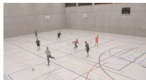
Sportabig-Projekt der Jugendarbeit Lindau: 2 ½ Stunden Spiel und Spass in der Turnhalle Grafstal. Das Projekt wird in Zusammenarbeit mit dem FC Kemptthal durchgeführt.

Die Jugendarbeit startete wie bereits letztes Jahr mit dem Sportabig-Projekt erfolgreich ins neue Jahr. Von Januar bis März fand ergänzend zum Jugendbüro und Jugendtreff am Samstag-Abend ab 19.30 Uhr in der Turnhalle in Grafstal – in Zusammenarbeit mit dem FC Kemptthal – der Sportabig statt. Die Abende wurden von den Jugendlichen rege besucht. Gemeinsam wurde Fussball gespielt, geturnt und geschwätzt – die 2 ½ Stunden in der Turnhalle konnten von den Jugendlichen frei gestaltet werden, was sichtlich geschätzt wurde. Als Erweiterung unseres Bewegung- / Sport-Angebots fand dann im April auch ein Sportnachmittag für Kids ab der 4. bis 6.Klasse, in der Turnhalle des Schulhauses Buck, statt. Der Sportnachmittag fand grossen Anklang und es herrschte eine freudige Stimmung.