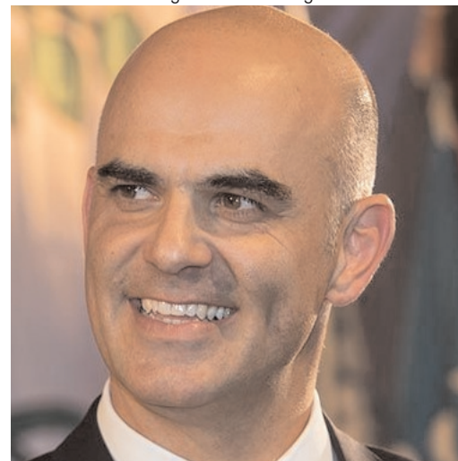
Hoher Besuch in Lindau! Bundesrat Alain Berset zu Gast an Lindauer Bundesfeier auf dem Strickhof-Areal in Eschikon.

«Lindau fäschtet» – ein rundum gelungenes Fest, dass uns noch lange in Erinnerung bleiben wird!