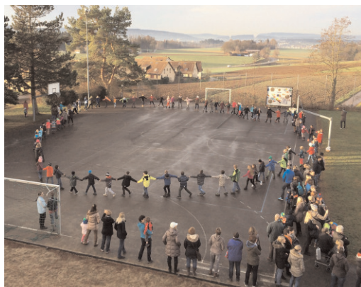
Schuljahresbeginn im Schulhaus Buck

tung. Zusammen mit drei Experten der Präventionsabteilung Jugendintervention der Kantonspolizei Zürich haben sich Lehrerschaft und Schulpflege mit dem Thema Zielgerichtete Gewalt und Amok an Schulen auseinandergesetzt. Den Nachmittag nutzten die drei Schuleinheiten zur individuellen Weiterbildung.