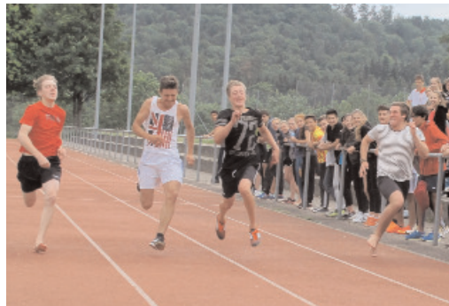
Sportanlass in der Oberstufenschulanlage Grafstal