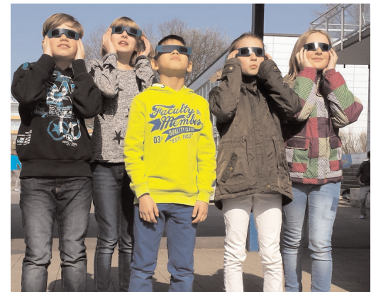
Sonnenfinsternis im Schulhaus Bachwis

Der Elternrat der Schule Lindau setzt sich für konstruktive und offene Zusammenarbeit zwischen Erziehungsberechtigten, Lehrpersonen und Schulpflege ein und ermöglicht einen regelmässigen Kontakt und Informationsaustausch. Er fördert das gegenseitige Verständnis zwischen Elternhaus und Schule und unterstützt aktiv vorhandene und initiiert neue Projekte. Wir danken dem Elternrat für die Unterstützung beim Besuchsmorgen, Samichlaus-Apéro, Räbelichtliumzug, Fackellauf und dem Wettbewerbtag auf der Sekundarstufe sowie bei weiteren Projekten und Schulanlässen.