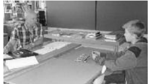
Bewerbungssituationen eins zu eins nachgestellt.

schnitt beginnen wird und dass sie gut darauf achten sollen, wie sie die Weichen für die Zukunft stellen. Viele der Schüler bewiesen, dass sie schon einen relativ klaren Plan vor Augen haben, während andere noch ein bisschen mehr Informationen brauchten, in welche Richtung der Weg der Berufswahl gehen soll. Herr Trindler hat auch klar aufgezeigt, dass er und das BIZ Uster jederzeit für die Jugendlichen da sei und sie mit offenen Armen zu einem Gespräch empfangen wird. Auch die wichtige Rolle der Eltern wurde aufgezeigt und konnte hoffentlich viele der Schüler dazu motivieren, gemeinsam mit den Eltern diesen Weg zu beschreiten.