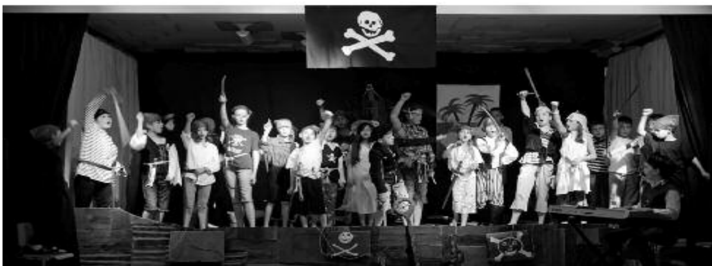
Die Piraten waren los im Schulhaus Bachwis...