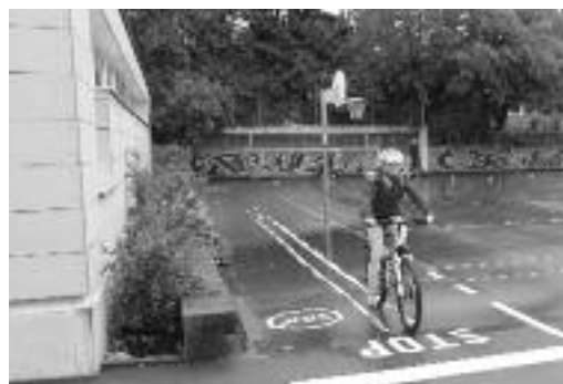
Geradeaus bis zur Stop-Markierung.

Mit der Eröffnung des 1. Veloparcours in Lindau wird ein wesentlicher Beitrag zur Förderung des Velofahrens der Kinder und somit ihrer Verkehrssicherheit auf unseren Strassen realisiert. Durch die Schaffung eines aufgemalten Parcours mit der entsprechenden