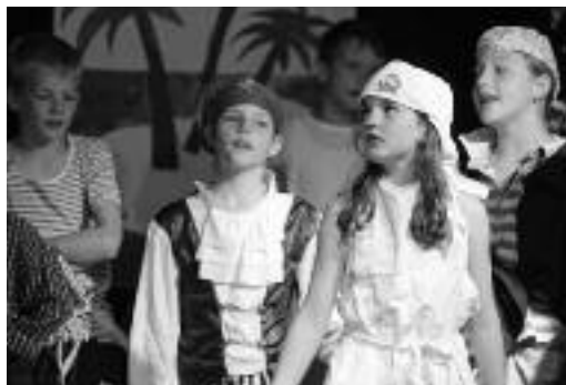
Die fröhlichen Piraten der 3. Klasse Bachwis.

Unbeschwertheit der Kinder wurde dieses Stück locker, fröhlich und mit so manchem Lacher über die Bühne gebracht.