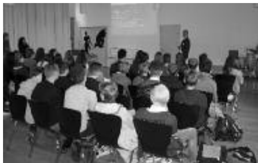
Der traditionelle Bewerbungstag nimmt einen hohen Stellenwert ein.

shops zur Arbeit am Computer, E-Mail-Verfassung, situative Telefongespräche führen und eine Frage/Antwort-Session mit Lernenden.