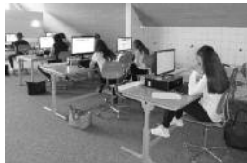
Da war Konzentration und Einsatz gefragt.

Zum Abschluss des Nachmittages trafen sich alle um 15 Uhr für eine letzte Feedbackrunde. Die Experten lobten die Schülerinnen und Schüler und bestätigten ihnen, sich gut und seriös auf diesen Tag vorbereitet zu haben. Sie seien überzeugt, dass dank diesem Projekttag alle mehr Sicherheit für den Bewerbungsprozess gewonnen hätten und dass die Berufswahl nicht immer geradlinig verläuft, sondern auch Umwege zum Berufsziel führen können. Sie wiesen nochmals darauf hin, dass man sich im Vorfeld intensiv mit der zukünftigen Tätigkeit beschäftigen soll und dass Schnuppertage in der Entscheidungsfindung helfen können.