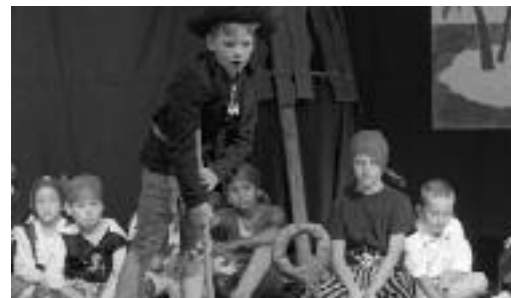
Die Piraten in voller Aktion.

Es ist schon wieder soweit: wir stehen kurz vor den Sommerferien und das bedeutet für die 3. Klässler des Schulhauses Bachwis – Theaterzeit. «Piraten lesen nicht» – so der Titel des Stückes. Diese Worte ringen einem schon ein erstes Schmunzeln ab.