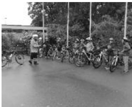
Letzte Instruktionen vor dem Start.

Die Gemeinde Lindau hat per Ende Jahr 2015 beschlossen, auf dem Pausenplatz des Schulhauses Bachwis in Winterberg einen Veloparcours zu erstellen. Die dafür erforderlichen Arbeiten und das Material wurden in den Frühlingsferien 2016 geliefert und ausgeführt. Die Planung wurde in Zusammenarbeit mit dem zuständigen Verkehrsinstruktor der Kantonspolizei und der Koordinationsstelle für Veloverkehr erstellt.