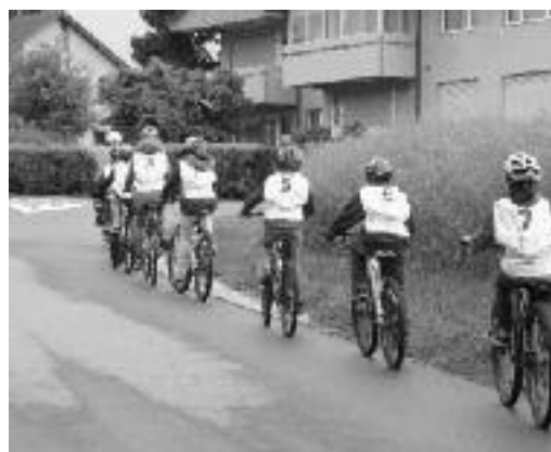
Am Schluss gehts gemeinsam auf die Strasse.

Am Morgen des 24. Mai wurde diese Anlage das erste Mal für die Velofahrschulung genutzt.