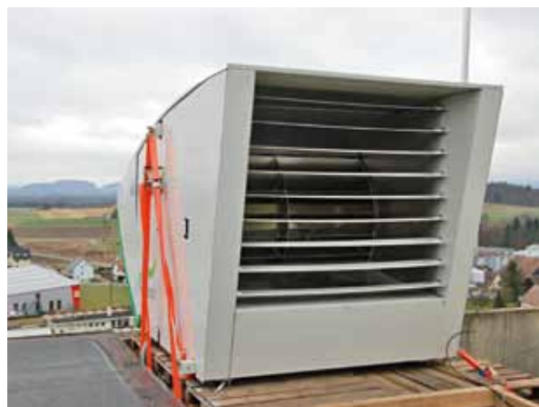
Der Prototyp des «WindRails» auf dem Dach des Getreidesilos der Landi in Marthalen gleicht einer Lüftung, nicht einem Windrad.