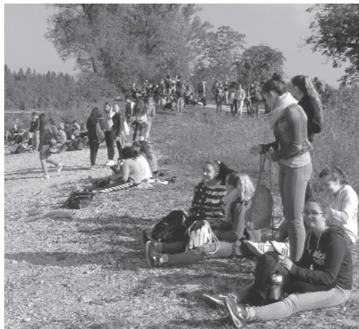
Gemütliche Mittagsrast am Rhein.