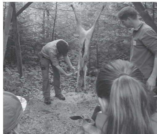
Fasziniert schauten die Schülerinnen und Schüler dem Tun der Jäger zu.