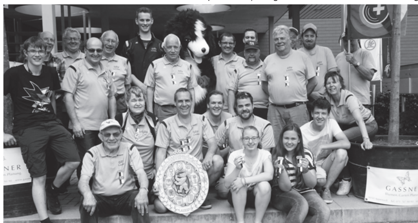
Die Lindauer Schützengruppe mit «Maskottchen» Sennenhund.

durch die Hauptgasse in Appenzell zu schlendern oder einen Jass im Festzentrum zu klopfen. Von allen Seiten wurde bestätigt, dass alles, d.h. von A (wie A-Scheibe) bis Z (wie Zielwasser) vorbildlich organisiert war. Auch wenn nicht alle ihr persönliches Ziel erreichten, war es ein toller Tag. Schade nur, dass jeder tolle Tag einmal zu Ende geht.