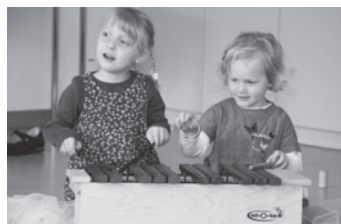
Früh übt sich...

Wallisellen, Bahnhofstrasse 13, Mittwoch, 9.30 bis 10.30 Uhr, 24. August und 31. August (Leitung K. Schweers)