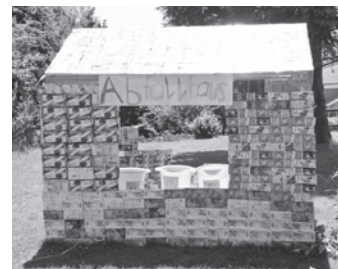
Nachhaltiger Unterricht: Das Abfallhaus im Schulhaus Buck.